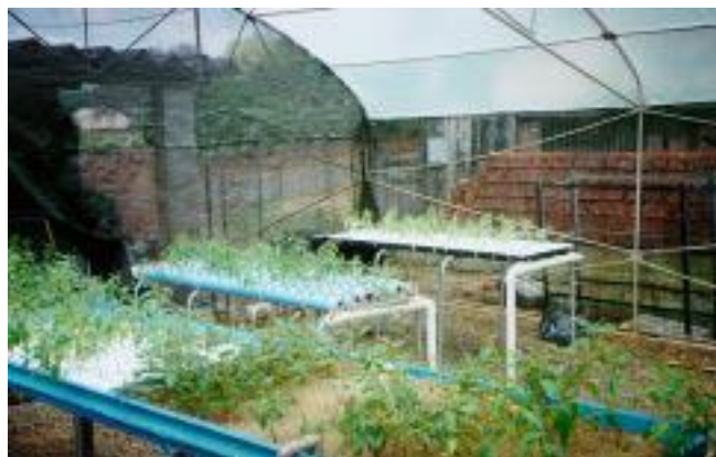
Figura 4. Sistemas alternativos de jardim clonal hidropônico, em ambiente protegido, instalado em Piracicaba, SP.

A primeira empresa florestal a iniciar um estudo piloto neste sistema de jardim clonal foi a Votorantim Papel e Celulose, em Luiz Antonio, SP, em 1997 (Figura 5). Empresas como a Lwarcel (Figura 6), Ripasa e a Cenibra (Figura 7) já adotaram operacionalmente a nova tecnologia. Estas empresas optaram pela