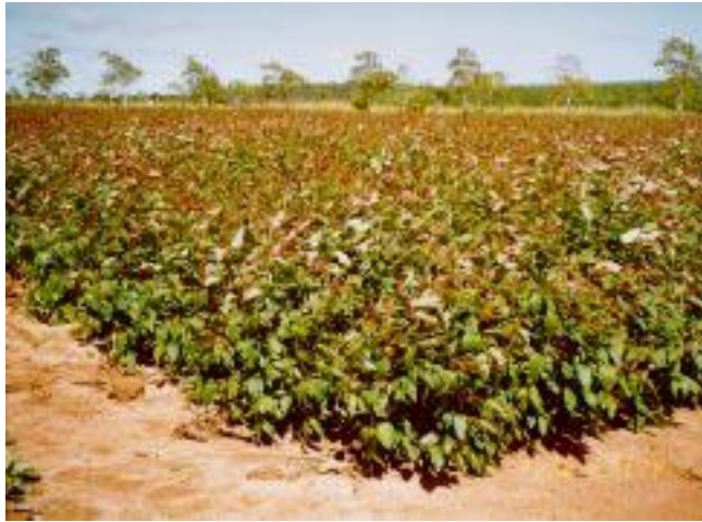
Figura 3. Vista geral do jardim clonal adensado com 40.000 plantas ha -1 , situado em Capão Bonito, SP.

protegido, usando-se de um sistema hidropônico fechado (IPEF, 1996). Vários sistemas hidropônicos foram testados: “floating”; calhas de fibra de vidro com substrato do tipo resina fenólica, “piscinas” de fibra de vidro ou tubos de PVC com substrato do tipo areia grossa ou resina fenólica (Figura 4). Este sistema foi denominado de minijardim clonal.