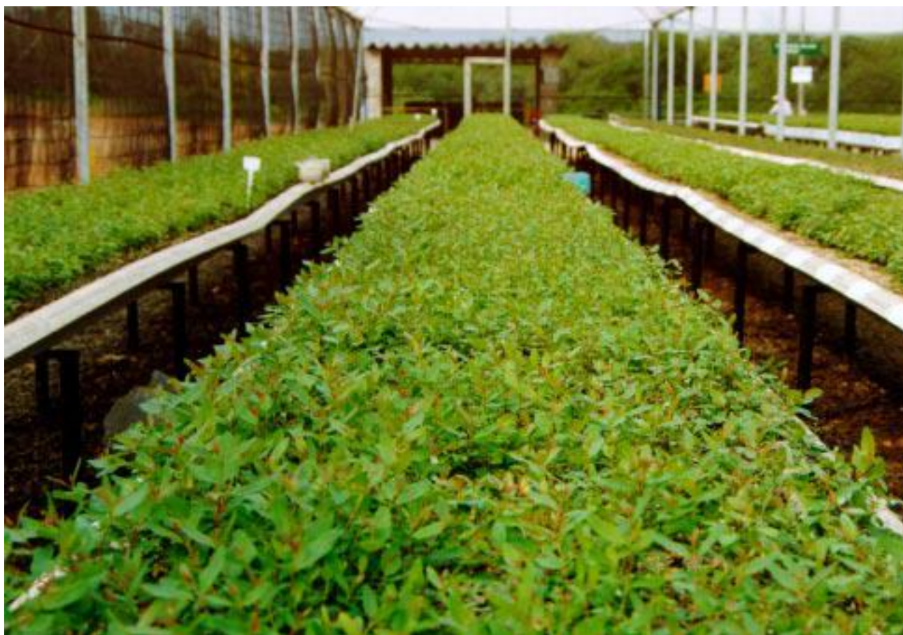
Figura 5. Vista geral do jardim clonal, em sistema de canaletão com substrato tipo areia, e fertirrigação por gotejamento, da Votorantim Papel e Celulose, Luiz Antônio, SP.