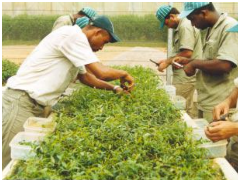
Figura 7. Aspecto geral do jardim clonal, na fase de coleta das miniestacas, em sistema de canaletão, com substrato tipo areia, e fertirrigação por regador, da Cenibra, Belo Oriente, MG.

instalação em calhetões de fibra-cimento, substrato tipo areia grossa, e fertirrigação com solução nutritiva, descritos por Higashi et al. (2000).