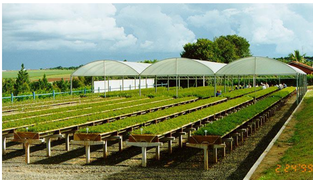
Figura 6. Vista geral do jardim clonal, em sistema de canaletão com substrato tipo areia, e fertirrigação por gotejamento, da Lwarcel, Lençóis Paulista, SP.